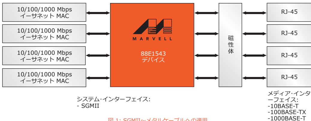
図 1: SGMII~メタルケーブルへの適用